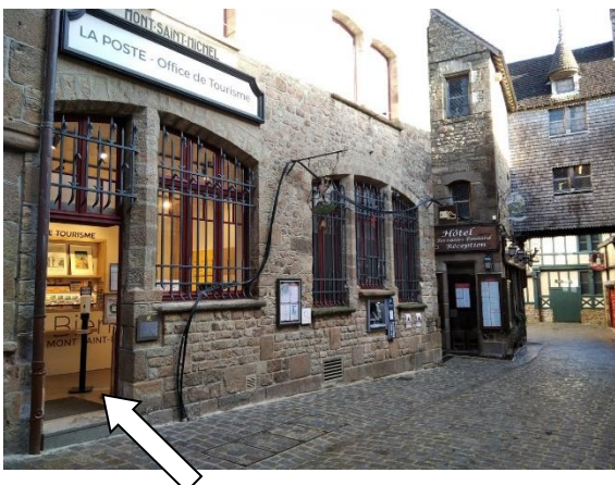
L'entrée de l'Office de tourisme

💻 Site Internet : www.ot-montsaintmichel.com