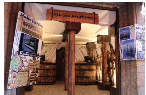
Le Musée de la mer