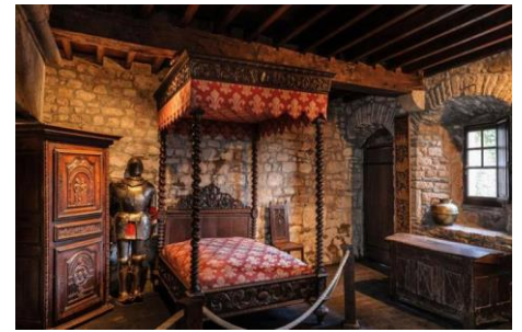
Le Logis Tiphaine

On visite une ancienne maison qui a été habitée par un chevalier.