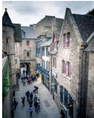
Les maisons anciennes