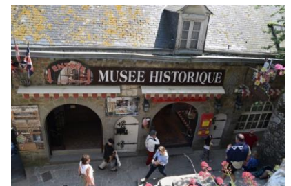
Le Musée Historique