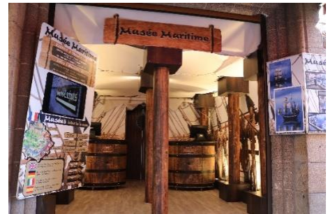
Le Musée de la mer